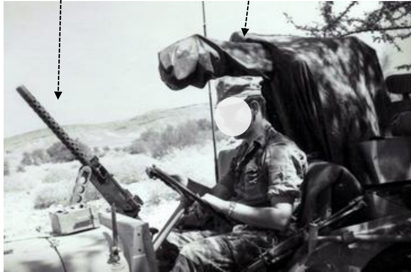
כך זה החל. הצריח נישא על ג'יפ סיור

מערכת יעילה ביותר אך משום מרכז כובד נוצרו בעיות בטיחות ושליטה ברכב, נדרשה מיומנות נהיגה ייחודית. בהמשך הותקן הצריח על נ.נ. ואף על זחל"מ