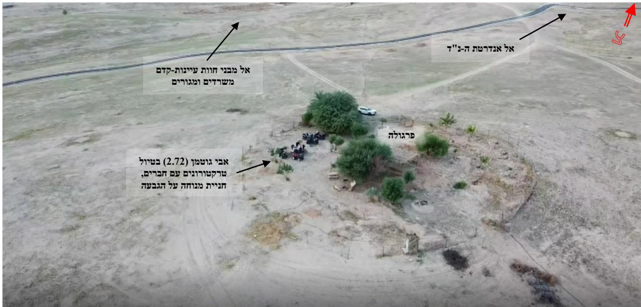
גבעת הרעות - מבט כללי (11 נובמבר 2020)

עם הזמן התחברו לרעיון ולמפגשים יותר ויותר אנשים מיוצאי סיירת חרוב מעבר לאנשי פלוגת קורן (פלוגה א') שהיו היוזמים והמייסדים.